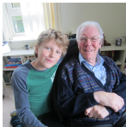
Deze week een foto van een trotse opa met zijn achterkleinzoon. Hij is nu een trouwe lezer van de jeugdboeken die ik 50 jaar geleden schreef.

genwoordigers van het ministerie, van de NS, van het streekvervoer, en ja, ook een paar marktonderzoekers. Urenlange discussies werden besteed aan het invoeren van zo'n tijdelijke jaarkaart. Dan zaten we weer met zo'n twintig mannen bijeen in een rokerige zaal – vergaderingen waren in die tijd nog doorgerookte festijnen – en spraken over alle aspecten van zo'n jaarkaart. Uren werden besteed aan het voorkomen van fraude. En dan de introductie bij het personeel! Stelt u zich zelf maar even voor, wat er voor komt kijken om het bus- en treinpersoneel in het hele land goed te informeren over een jaarkaart, die ze misschien ooit één of tweemaal te zien zouden krijgen van een passagier die toevallig in onze steekproef was gevallen en van het aanbod gebruik had gemaakt. Om een lang verhaal kort te maken: dat onderzoek heeft in plaats van dertigduizend gulden vele miljoenen gekost en het antwoord was uiteraard voorspelbaar: te weinig belangstelling voor zo'n jaarkaart. Maar het kamerlid toonde zich tevreden dat er goed onderzoek was verricht. De grootste gotspe vond ik de opmerking van de opdrachtgever dat onze boeken konden worden gecontroleerd door de rijksaccountant, want, zo zei hij, het was ten slotte geld van de belastingbetaler dat wij uitgaven.