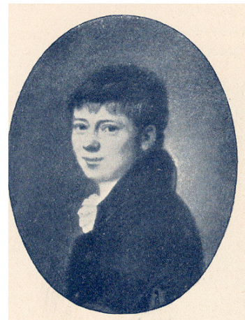
Heinrich von Kleist (1777-1811)

Het toneelstuk Käthchen von Heilbronn is eigenlijk een gedramatiseerd sprookje. De vrouwelijke hoofdpersoon, blijkbaar een meisje van eenvoudige komaf, voelt zich aangetrokken tot de graaf Von Stahl. Het is een mysterieuze, heftige liefde waaraan ze geen weerstand kan bieden. Ze dringt zich aan hem op en weigert heen te gaan. Ze wil eeuwig bij hem blijven. Ze blijft hem trouw gedurende een reeks van ridderlijke en bovennatuurlijke avonturen. Tenslotte wordt ontdekt dat ze een dochter is van de keizer en kan ze dus trouwen met haar geliefde graaf.