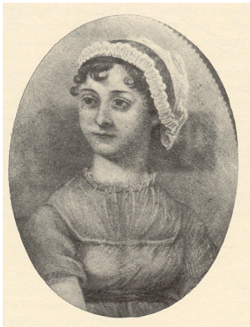
Jane Austen, getekend door haar zuster Cassandra.

Dit jaar is het precies tweehonderd jaar geleden dat een boek van de pers rolde dat tot in onze tijd een bestseller is gebleven. De Engelse titel luidt Sense and sensibility . In Nederland verscheen het in 1954 als Meisjeshoofd en meisjeshart in de Prismareeks, later als Verstand en onverstand . Het is vele malen verfilmd, er zijn TV-series van gemaakt en het is vertaald in vrijwel alle wereldtalen. De schrijfster was Jane Austen (1775 – 1817), misschien wel de belangrijkste schrijfster van die tijd. In ieder geval is zij een van de weinige die twee eeuwen later nog altijd door miljoenen wordt gelezen. Toch zijn al haar boeken tijdens haar leven anoniem verschenen. Een Londense uitgever weigerde haar meesterwerk Pride and Prejudice en wilde het zelfs niet tegen betaling van de onkosten uitgeven.