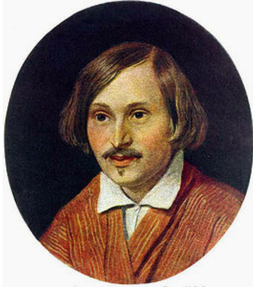
Nikolaj Gogol (1809-1852)

Ondanks een voortdurend bewind van repressie en censuur zou Rusland ook na Poesjkin nog vele indrukwekkende schrijvers hun bijdragen aan de wereldliteratuur zien leveren. Niet de minste van hen was Nikolaj Vasiljevitsj Gogol (1809 – 1852) . Hij was een persoonlijkheid vol innerlijke tegenstrijdigheden. Ooit schreef hij een pleidooi ter verdediging van kerk, autocratie en lijfeigenschap, die de intellectuele Rus van die dagen als de plechtankers van Ruslands achterlijkheid, barbarij en armoede beschouwde.