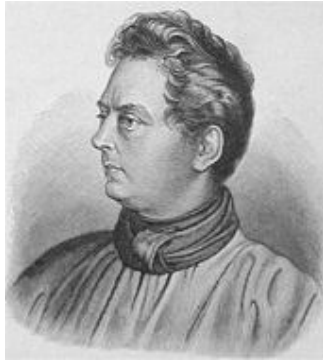
Clemens Brentano (1778-1842)

In het midden van de negentiende eeuw bewoog de literatuur zich tussen droom en werkelijkheid. In Duitsland vierden de schrijvers van sprookjes ware triomfen. Het was begonnen met de gebroeders Grimm (zie de aflevering over 1812). Ze kregen vele navolgers die allen in het Huis met de honderd ramen de revue passeerden, zoals Heinrich von Kleinst (1910), Adalbert von Chamisso (1813), Ernst Th. W. Hoffmann (1821), Wilhelm Hauff (1827) en Hans Christian Andersen (1835). Een van hun laatste volgelingen was Clemens Brentano, wiens bundel Märchen in 1846 verscheen. Ze zijn wat minder bekend dan die van Grimm en Andersen, vooral omdat ze wat minder geschikt zijn voor kinderen.