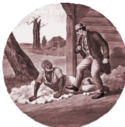
Simon Legree bedreigt Oom Tom

Het boek vertelt over de lotgevallen van een aantal slaven in en om een plantage in de Amerikaanse staat Kentucky. Onder hen zijn Eliza en vooral Oom Tom, slaven van de vriendelijke plantagebezitter Shelby. Het verhaal begint op het moment dat hun leven ruw verstoord wordt door de financiële situatie van Shelby, die zich gedwongen ziet Oom Tom en Eliza's zoontje te verkopen. Het boek beschrijft de poging van Eliza om met haar zoontje te vluchten. Intussen vlucht Eliza's man George ook - hij is slaaf van een andere eigenaar en wordt door zijn meester mishandeld. Oom Tom verzet zich niet tegen de verkoop. Hij wordt verscheept naar de gevreesde katoenplantages en komt uiteindelijk in handen van de bullebak Simon Legree, die de volgzame slaaf doodmartelt.