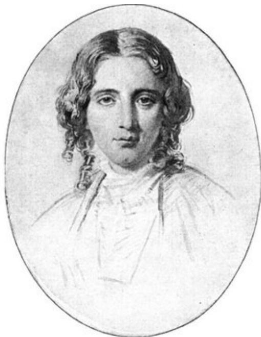
Harriet Beecher Stowe (1811-1896)

De negerhut van Oom Tom van Harriet Beecher Stowe is een van de bekendste boeken uit de Amerikaanse literatuur. Het werd in 1852 gepubliceerd nadat het eerst tussen 1851 en 1852 als serie was verschenen en oefende een enorme invloed uit op de heersende opvattingen over slavernij. De oorspronkelijke titel is Uncle Tom's Cabin or Life among the Lowly .