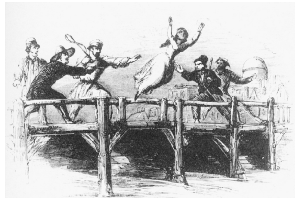
De dood van Clotel

Het boek vertelt het verhaal over een vrouw (Currer) en haar dochters Althesa en Clotel. Thomas Jefferson is hun vader. De meisjes zijn bijna blank. Na de dood van Jefferson worden ze verkocht. Terwijl Currer en Althesa in slavernij blijven, wordt Clotel gekocht door Horatio Green, een blanke, die haar behandelt als zijn echtgenote hoewel ze niet wettelijk kunnen trouwen. Ze krijgen een dochter, Mary, Maar dan wil Green een rol gaan spelen in de politiek. Hij verlaat Clotel en haar kind om te trouwen met een blanke vrouw. Hij gehoorzaamt dan aan haar eisen, en verkoopt Clotel en Mary als slavinnen. Gekleed als een blanke man ontvlucht Clotel naar Ohio. Haar medevluchter ontkomt naar Canada. Zelf keert ze terug naar Virginia in een poging haar dochter te bevrijden. Ze wordt in Washington DC gearresteerd, maar ontsnapt weer. Omringd door slavenjagers op de Long Bridge pleegt ze zelfmoord door in de rivier te springen.