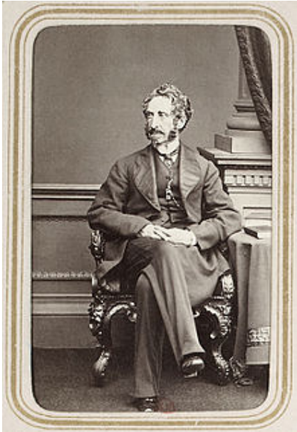
Edward Bulwer Lytton (1803 – 1873)