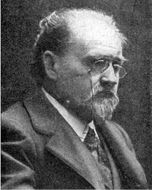
Emile Zola (1840-1902)