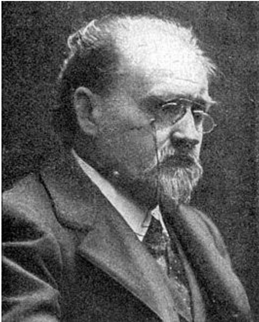
Emile Zola (1840-1902)

Germinal (in het Nederlands ook uitgegeven als De mijn ) is één van de 20 delen uit de verhalencyclus Les Rougon-Macquart van Émile Zola. In Germinal brengt Zola de barre omstandigheden van het leven van de 19e-eeuwse mijnwerkers aan het licht. De titel is afgeleid van de republikeinse kalender en staat voor de lentemaand. Hieruit blijkt de cultus van de vernieuwing: de hoop op een nieuw leven voor de mijnwerkers. Zola documenteerde zich uiterst zorgvuldig voor het schrijven van dit verhaal. De details waren zo realistisch dat ze vaak zelfs als choquerend werden ervaren. De mijnwerkers worden beschreven als menselijk vee, waarbij de lelijkheid wordt benadrukt: ze zijn namelijk bleek met blauwe plekken,... Deze beschrijvingen zijn niet toevallig zo grijpend, Zola had een achterliggende aanklacht, nl.: armoede maakt lelijk / de lelijkheid van de armoede. Het werk heeft een epische toon en kent een zekere grandeur met zijn vele metaforen, zo wordt de fabriek bijvoorbeeld voorgesteld als iets dat mensen opslokt. Zola had een opmerkelijke betrokkenheid met de beschreven wereld opgebouwd, waardoor het werk een functie van emancipatie mee krijgt.