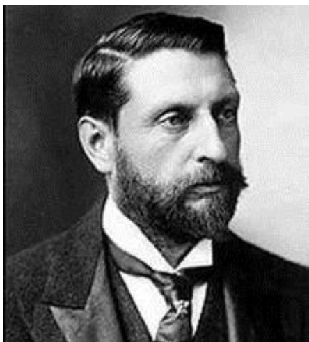
Sir Henry Rider Haggard 1856-1925