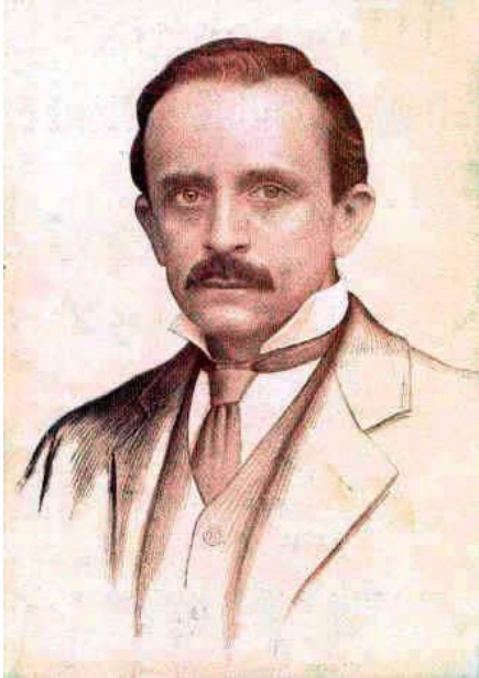
James Matthew Barrie (1860-1937)